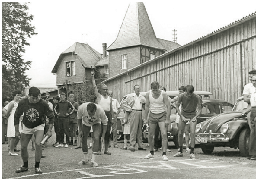
Start zum Brunnenlauf in den 1960er Jahren.

Neben dem Ausüben der unterschiedlichen Sportarten galt es aber auch, den Aufbau von Sportstätten zu fördern bzw. die vorhandenen ehrenamtlich entstandenen Anlagen modernen Gegebenheiten anzupassen. Viele