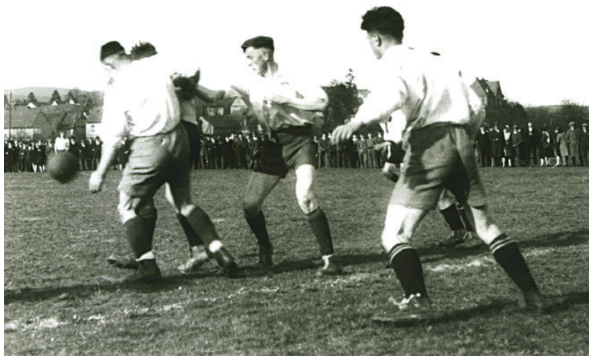
Spielezene um 1930, als die Fußballbegegnungen noch gut besucht in den Biskirchener Lahnwiesen stattfanden.

Jahre fanden die Fußballbegegnungen unter Berücksichtigung landwirtschaftlicher Bedürfnisse und der Hochwassersituationen in den Lahnwiesen „Au“ und „Lach“ und erst nach dem Bau des Sportplatzes westlich des Ulmbaches, auf dem heutigen Sportgelände, statt. Seit gut drei Jahrzehnten bietet der Hartplatz bei der Lahn-Ulm-Schule eine weitere Ausweichmöglichkeit.