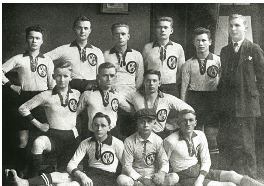
Der 1921 ins Leben gerufene „Verein für Rasensport“ (VfR) Biskirchen.

Basis für weitere Ideen, wie z. B. den Bau einer Turnhalle in unmittelbarer Nähe zur alten Ulmbachbrücke an der Weilburger Straße, die jedoch nie zur Ausführung kam.