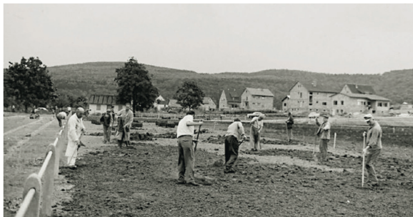
Sportplatzbau unter ehrenamtlichem Einsatz der TSG-Mitglieder im Jahr 1965.