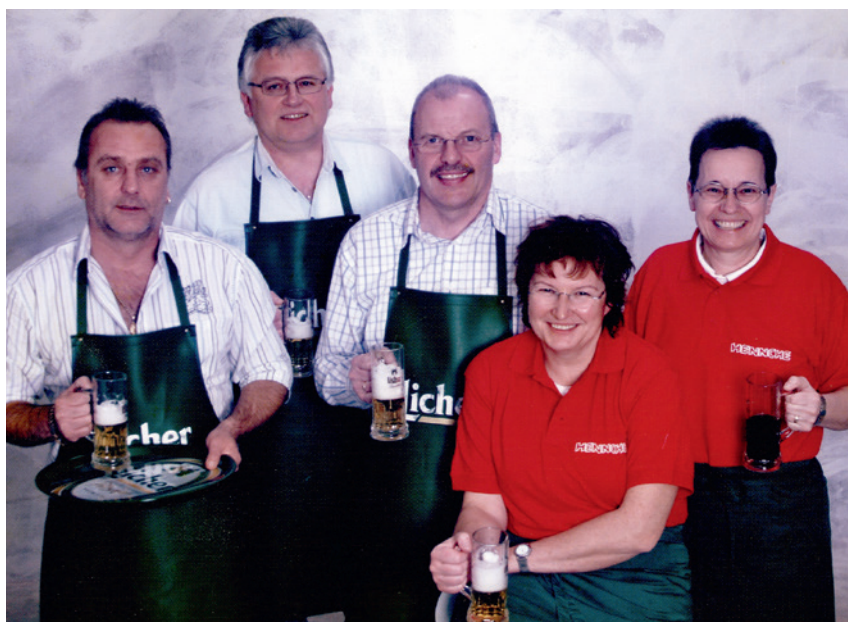
Der Bewirtungsausschuss zum 100-jährigen Jubiläum der TSG 2008.