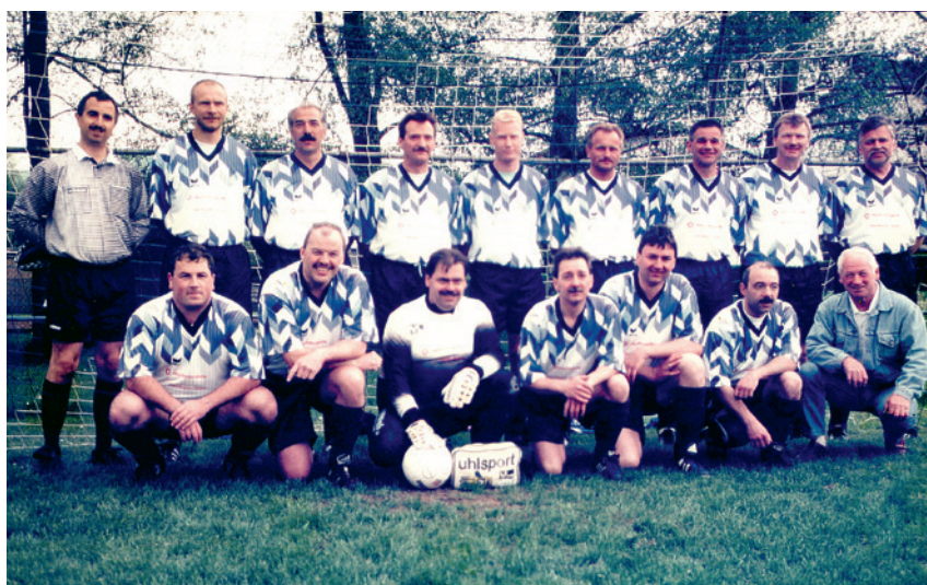
Die Alten-Herren im Sommer 2001.