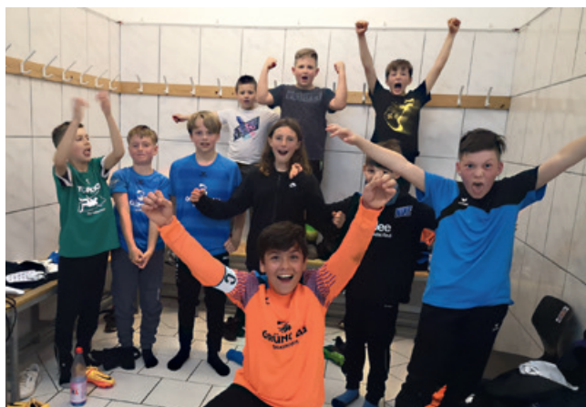
Kabinenfeier der E-Jugend nach dem 15:2-Sieg gegen den VfB ABlar.

großer Teil der Mannschaft aus den beiden B-Jugend Jahrgängen 2006 und 2007 bestand, lässt sich mit Blick auf die spielerische Entwicklung der Mannschaft ein positives Fazit ziehen. Besonders hervorzuheben ist hier das Spiel gegen den Meisterschaftskandidaten JSG Albshausen/Steindorf/Braunfels im Dezember 2022, welches das Team nach einer sehr guten Leistung mit 3:1 für sich entscheiden konnte und dies mit einer rauschenden Kabinenparty feierte.