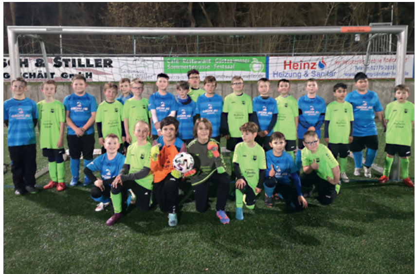
Die Mannschaft nach dem Freundschaftsspiel am 22. Februar 2023 in Beilstein.

Im Punktspiel gegen die JSG Burgsolms IV platzierte der Knoten endgültig und man siegte mit 13:1 und auch gegen VfB Asslar III siegte man völlig verdient mit 15:2. Nach diesem Spiel war klar, die E-Jugend möchte die Rückrunde in der Gruppe 3 auf Platz 1 beenden. In der Kabine wurde ausgiebig der Sieg gefeiert. Dazu musste man aber erstmal im Spitzenspiel gegen den FC Schöffengrund III zuhause siegen. Es war das erwartete Spitzenspiel, welches bis zur Halbzeit recht ausgeglichen war. Am Ende überzeugte die Mannschaft und siegte mit einer überlegenen zweiten Hälfte mit 9:4. Ein Sieg trennte nun die Mannschaft noch vom 1. Platz und dies sollte am vorletzten Spieltag gegen den Gastgeber aus Büblingshausen IV gelingen. Aber der Gastgeber hatte etwas dagegen und machte uns das Leben schwer. So verlor man dieses Spiel mit 2:1. Am letzten Spieltag machte dann die Mannschaft alles zuhause klar und siegte gegen Cleeburg III mit 10:1.