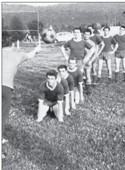
... Spiel mit dem Ball ...