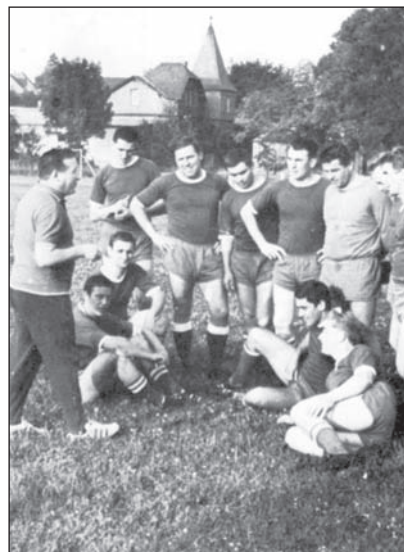
... und Lehrstunde Taktik.

Die Mannschaft hatte sich eine gute Ausgangsposition geschaffen und hätte am vorletzten Spieltag am 21. April bei hochsommerlichen Temperaturen vor etwa 800 Zuschauern mit einem Sieg gegen den nur um einen Punkt schlechter platzierten FSV Braunfels den Aufstieg schon klar machen können. Doch sie verlor sensationell hoch mit 4:0 Toren und Braunfels übernahm mit einem Punkt Vorsprung die Tabellenführung.