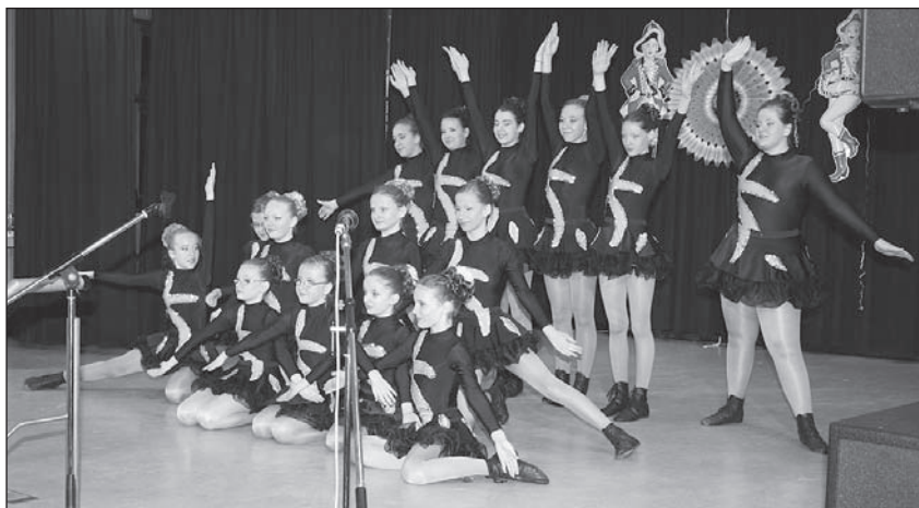
Die frechen Früchtchen hatten Samstag und Montag ihren großen Auftritt.

Doch auch die Gruppen „Dancing Queens“, Damengymnastik, „X-Dream“ und die „Champagnes“ förderten diesen Zustand. Ganz heimtückisch kam