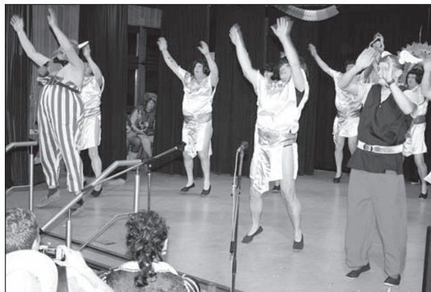
Diese Elfen nähen sogar die Kostüme selbst.