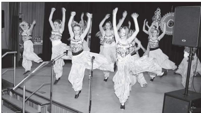
Nach Bollywood entführten die Dancing Queens.

Besonders seltsam kann man den Verlauf bei den „Rüsselelfen“ sehen. Dort finden nicht nur arrhythmische Bewegungen statt, nein, sie glauben sich urplötzlich auch noch in fremden Kul-