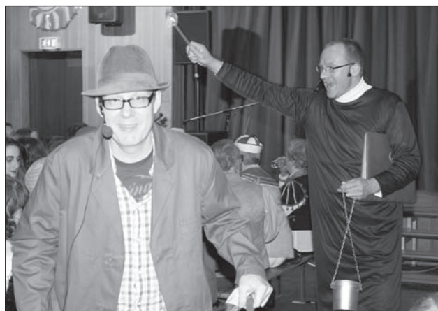
„M&M“ waren eine feuchte Angelegenheit.

Leider ist der Platz für Bilder nur begrenzt, eine größere Auswahl Fotos finden Sie unter http://www.tsgbiskirchen.de/veranstaltungen/fasching/