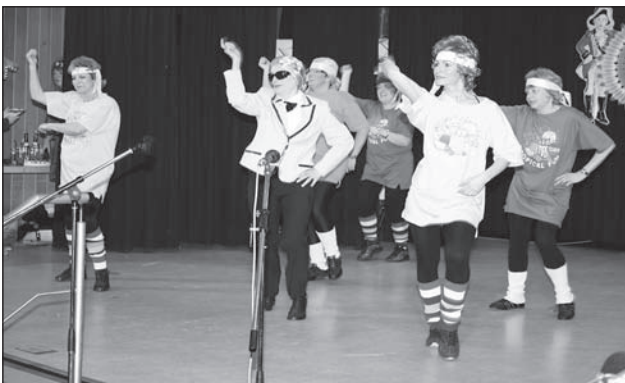
Beim Gangnam-Style der Volleyballer brannte die Hütte.