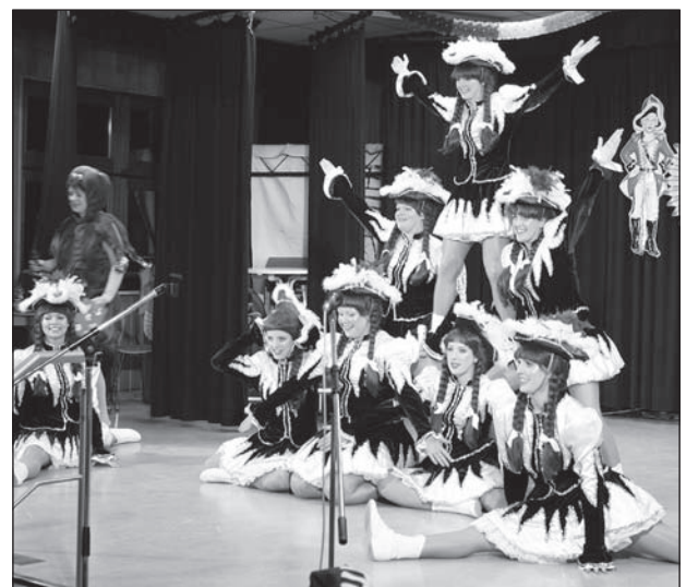
Mit diesen Kostümen sticht die Garde auch beim Wetzlarer Karnevalszug alle anderen aus.

Ansteckung mit dem Virus Karnevalitis wirklich ist. Ist man ihm einmal ausgesetzt, kann man ihm nicht entkommen. Doch in diesem Jahr bekam die Karnevalitis einen ernstzunehmenden Gegner. Der Virus „ich versau dir den Fasching Restus“ griff urplötzlich an und beförderte viele Narren viel zu schnell in eine horizontale Position. Wenn man den Genußprozess der Karnevalitis vor Aschermittwoch abbricht, können sich akute Entzugsstadien entwickeln. Mich selbst erwischte es in der Nacht von Samstag auf Sonntag. Ich steckte mich „im grünen Ei“ an, sodass ich in akuten „Entzug“ kam. Schweißgebadet kämpfte ich gegen den Herdentrieb an, an dem für alle so wunderbar gefühlten Wetzlarer Karnevalszug teilzunehmen. Tags drauf ließ ich meinen Posten im Hofstaat unbesetzt und die Thekenmannschaft im Stich. Bei 150 fröhlich feiernden Gästen im Saal, die durch die Beschreibung „Kinderfasching“ dorthin gelockt wurden, ver-