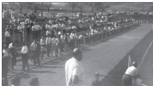
Etwa 800 Zuschauer erlebten die bittere 0:4-Heimniederlage der TSG.