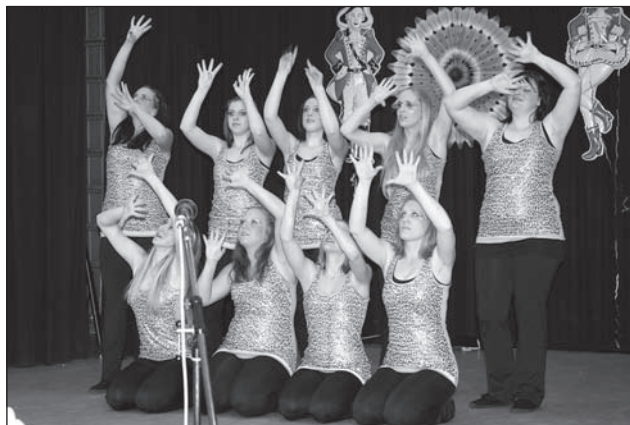
Die Champagnes tanzten das Thema „Liebe“.