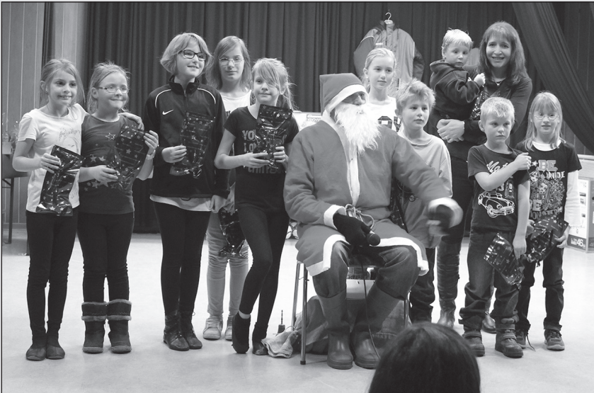
Der Nikolaus und ein Teil der „beschenkten“ Kinder.

Der Vorstand der TSG Biskirchen möchte sich nochmals bei allen Gästen bedanken. Wir haben uns sehr über euren Besuch gefreut. Ebenfalls möchten wir uns nochmal ausdrücklich bei allen Sponsoren der Tombola bedanken. Nicht zu vergessen sind die „Wasserbüffel“, die freiwillig an diesem Abend die Bewirtung für uns übernommen haben. Vielen Dank! (SH)